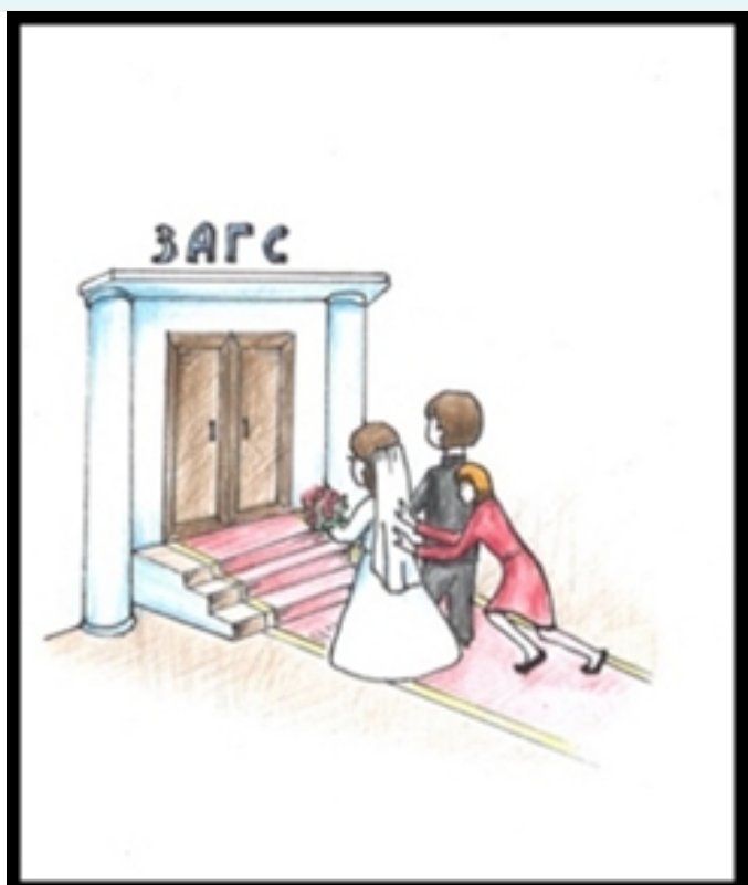
Рис. 3. Что значит не хочу? А ну вперед, а то домой не пушу!

1) В свидетельстве о рождении ребенка указан отец, которого фактически нет - презумпция отцовства - юридическое значение - отцом признается бывший муж матери, если ребенок родился в течение 300 дней после развода/смерти/признания брака недействительным. Цель: установление отца в целях искоренения "безотцовщины" и взыскания алиментов с недобросовестного отца.